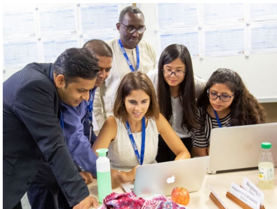
Figure 2. Université d'été du CIRC 2019 : module sur la mise en œuvre de la prévention et de la détection précoce du cancer.

Les Groupes scientifiques du CIRC organisent des cours spécialisés ou de perfectionnement, parfois avec l'assistance du Groupe ETR. La plupart de ces cours sont liés à des projets d'étude collaborative pour lesquels le Centre transmet les compétences nécessaires à leur réalisation et à la mise